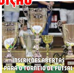
INSCRIÇÕES ABERTAS PARA O TORNEIO DE FUTSAL