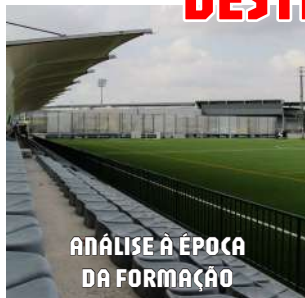
ANÁLISE À ÉPOCA DA FORMAÇÃO