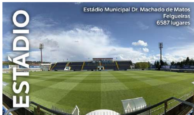
Estádio Municipal Dr. Machado de Matos Felgueiras 6587 lugares

Foi também na temporada 2023/2024 que o novo FC Felgueiras regressou aos campeonatos profissionais. Na fase regular da Liga 3, terminou na liderança da Série A, e na fase do apuramento do campeão foi o segundo classificado. Tal marco aconteceu, então, 19 anos depois da descida do "primeiro" FC Felgueiras. Numa análise à história do clube desde 1932, destaca-se ainda a sua única presença na Primeira Liga, na época 1995/1996.