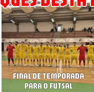
FINAL DE TEMPORADA PARA O FUTSAL